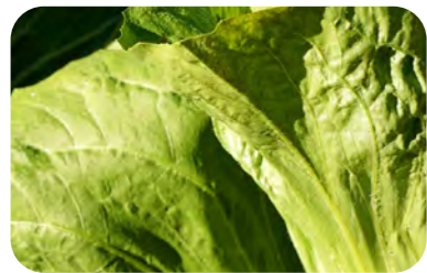
Chicorée pain de sucre