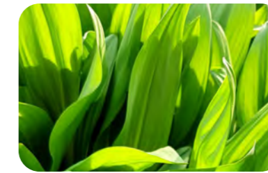
Ail des ours