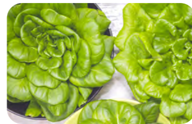
Feuille de chêne