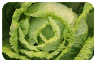
Chou de Chine